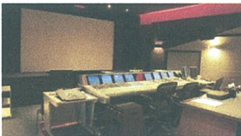
代々木公園スタジオ 「Stage2 Music」