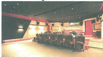
銀座スタジオ = Flame Premium の Studio-1 (左) と Studio-2