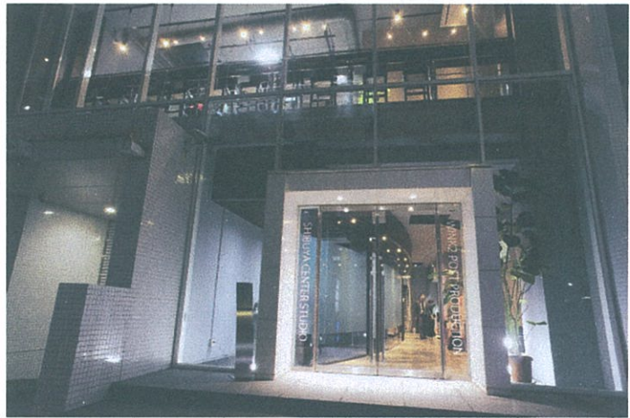
WINK2 渋谷センタースタジオのエントランス

㈱ウインクツー（WINK2）はこのほど、新たな番組編集拠点として、NHK 放送センター至近で井の頭通りに面する「渋谷センタースタジオ」をオープン、4月1日から本格稼働を開始した。新拠点「渋谷センタースタジオ」は、渋谷地区においては道玄坂スタジオ / 西口スタジオ / 代々木公園スタジオに次いで 4 拠点目、主に CM 対応となる銀座スタジオを含めると 5 拠点目のスタジオとなる。これにより同社のポストプロダクション体制は、HD PD 編集室 × 34 室、HD リニア編集室 × 3 室、HD ノンリニア編集室 × 10 室、フルデジタル MA 室 × 9 室、ダビングステージ × 1 室、録音ステージ × 1 室、デジタイズルーム × 3 室、CG 室、コピー室という構成となった。