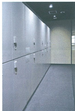
セキュリティーテープロッカー

スタジオ館内には、10 台の監視カメラ、Felica 対応の各部屋入退出セキュリティーシステムなどセキュアな環境下でのコンテンツ制作が可能で、各編集室に対応したセキュリティーテープロッカーも有する。1 階のミーティングルーム×3 室は、各部屋からのプレビュールームとしても使用できる。館内のインターネット接続は NURO 2Gbps 高速回線を導入し、顧客ファイルサーバー、データファイルサーバーなど高度なネット環境でのインフラを整備している。