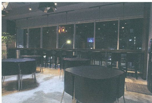
スイッチャーに MVS-8000 を装備した HD リニア編集室 (左) と 2階ラウンジ (右)