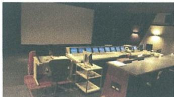
代々木公園スタジオ 「Stage1 Cinema」