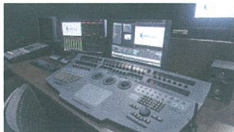
西口スタジオ Pablo ルーム (上) と MA ルーム (下)