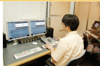
デジタルズルーム

音声素材 PCM-3324 マルチオーディオ /6mm テープ /DAT オーディオ /DA-88 マルチオーディオ /カセットテープ Mfx3 EXABYTE/ QDC File etc CD-R/DVD/R/BD コピー業務